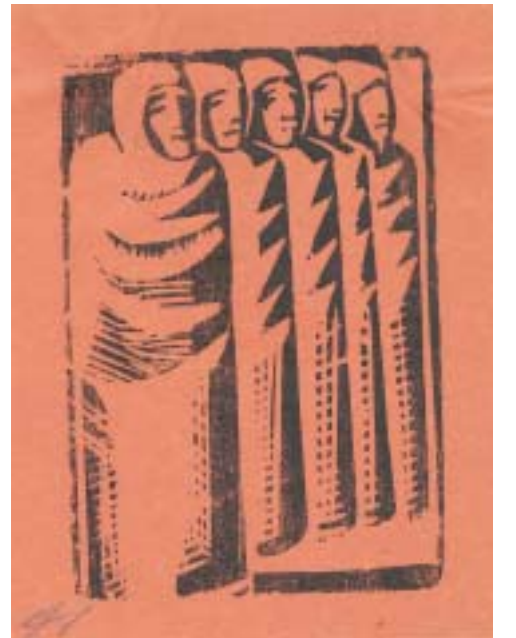
Méndez, Leopoldo, Calaveras de inundación, Linóleo Toledo, Francisco, Sapos bibliófilos, Aguafuerte, Punta seca Méndez, Leopoldo, El fascismo I, Xilograf'a, B/N Méndez, Leopoldo, Lo que puede venir, Xilografía Nieto, Rodolfo, En las vizcainas, Linóleo